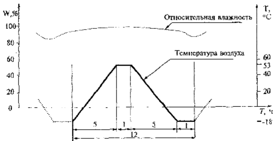
Рис. А.2. График одного цикла испытаний (первая часть испытаний по режиму IV)